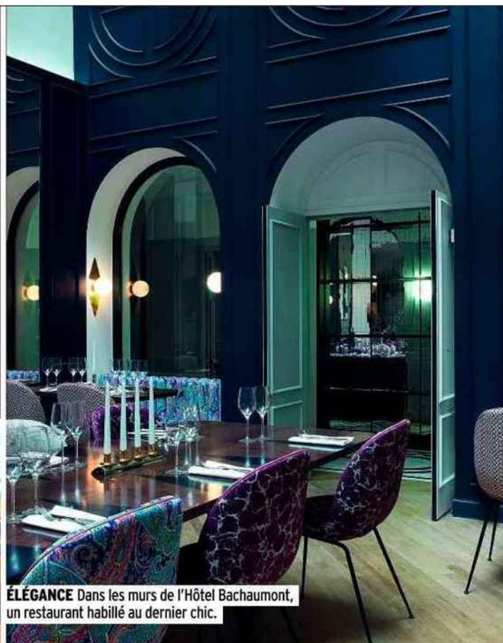
ÉLÉGANCE Dans les murs de l'Hôtel Bachaumont, un restaurant habillé au dernier chic.