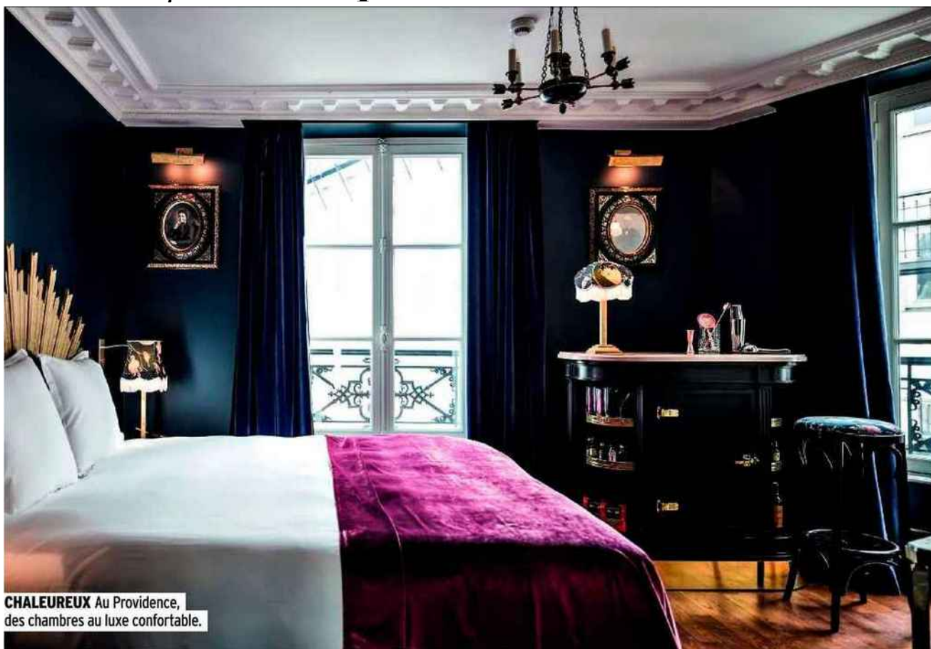
CHALEUREUX Au Providence, des chambres au luxe confortable.