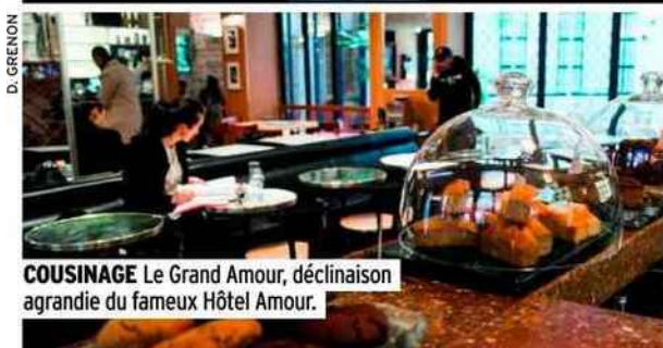
COUSINAGE Le Grand Amour, déclinaison agrandie du fameux Hôtel Amour.